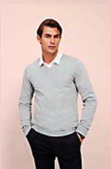
SOL'S GLORY MEN 01710