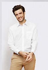
SOL'S BALTIMORE 16040