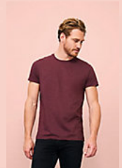
SOL'S REGENT FIT 00553