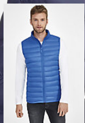
SOL'S WILSON BW MEN 02889