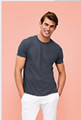
SOL'S REGENT 11380