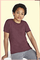
SOL'S REGENT FIT KIDS 01183